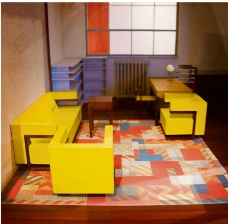
Maquette van een Bauhaus-kantoor (boven.)