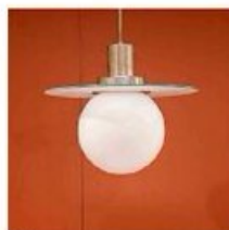
Bauhaus-plafondlamp van Marianne Brandt.

Van Doesburg was de voornaamste propagandist van De Stijl, ook al zo'n kunstbeweging die alles fris, strak, modern wilde. Dat leek bij Bauhaus aan te sluiten, maar in de praktijk pakte dat anders uit. Bauhaus leunde in het begin nog op het Duits expressionisme, Van Doesburg was veel 'moderner'. Dat was het ergste niet: Van Doesburg was fel en lastig in de omgang. Het boterde totaal niet tussen hem en Gropius.