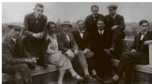
Gunta Stölzl, de enige vrouw onder de 'Bauhausmeister', op een groepsfoto uit Dessau, uit 1926. Van links naar rechts Josef Albers, Marcel Beuer, Gunta Stölzl, Oskar Schlemmer, Wassily Kandinsky, Walter Gropius, Herbert Bayer, László Moholy-Nagy, Hinnerk Scheper.