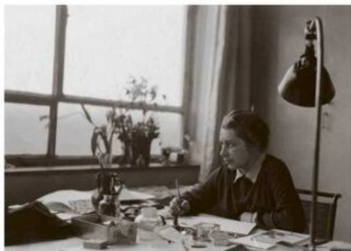
Gunta Stölzl in het Dessau Bauhaus.