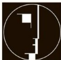
Bauhaus-vignet van Oskar Schlemmer.

De link tussen Drachten en Bauhaus is Theo van Doesburg, de ontwerper-schrijver die de opvallende kleuren heeft ontworpen voor de huizen aan de Torenstraat in Drachten – die daaraan de bijnaam Papegaalenbuurt dankt. Van Doesburg zat in die tijd ook in Weimar, in de overtuiging dat er ook voor hem, met zijn opvattingen over kleurgebruik in architectuur, ook een plek was weggelegd bij Bauhaus.